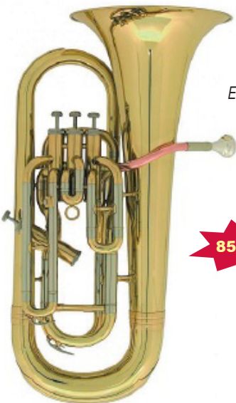
Euphonium MTP réf. 114 3 + 1 pistons en étui