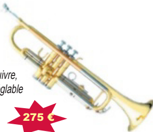
Trompette vernie, marque MTP T810 branche d'embouchure en cuivre, 2 clés d'eau, 3ème coulisse réglable en étui sac au dos avec embouchure 7C