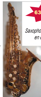
Saxophone soprano Denver en étui sac au dos